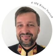
Impulsgeber OBSTL. MANFRED FRIES Stadtpolizeikommandant Wiener Neustadt